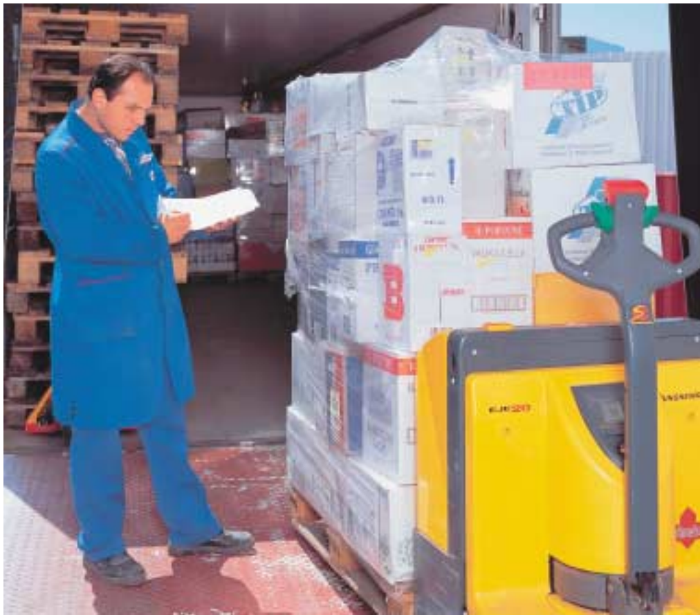
Konventionelle Techniken werden abgelöst: Metro arbeitet bereits an der unternehmensweiten Einführung von RFID auf Paletten und Transportverpackungen

Dazu wurden in einem ersten Schritt alle Paletten mit hochwertigen Waren aus dem Non-food-Distributionszentrum des Unternehmens in Milton-Keynes bei London mit RFID-Tags versehen. Automatisch erfaßt werden die Funk-Etiketten sowohl beim Verlassen des Auslieferungslagers wie auch bei