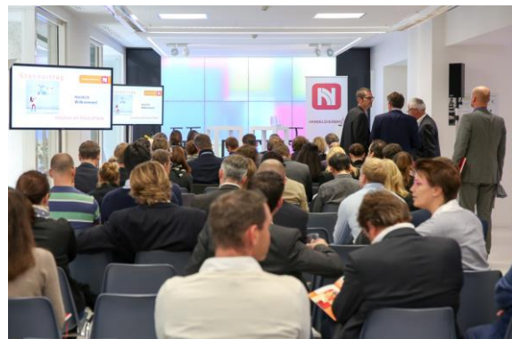
Eindrucksvolle Location: Das Zumtobel Lichtforum