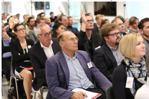
Aufmerksames Publikum: Rund 100 Gäste am Standorttag 2014