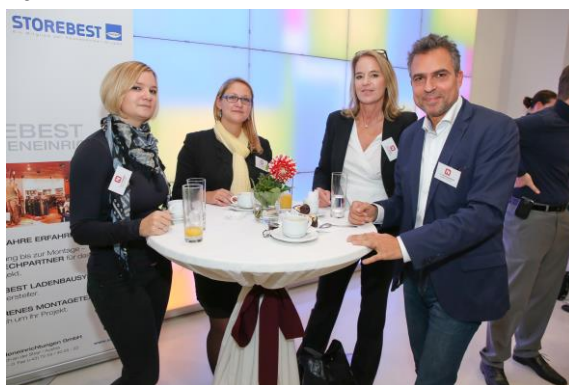
Networking beim anschließenden Cocktail-Empfang