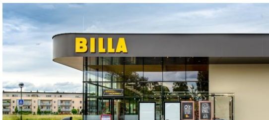
DIGITAL PROCESS MANAGEMENT