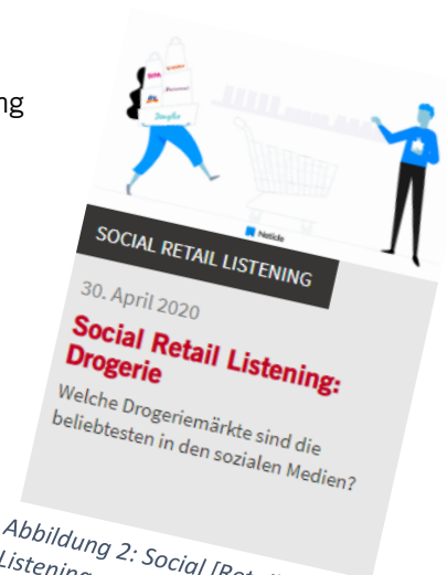
Abbildung 2: Social [Retail] Listening mit Neticle