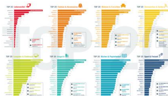
Abbildung 1: Digital Visibility Report mit Otago